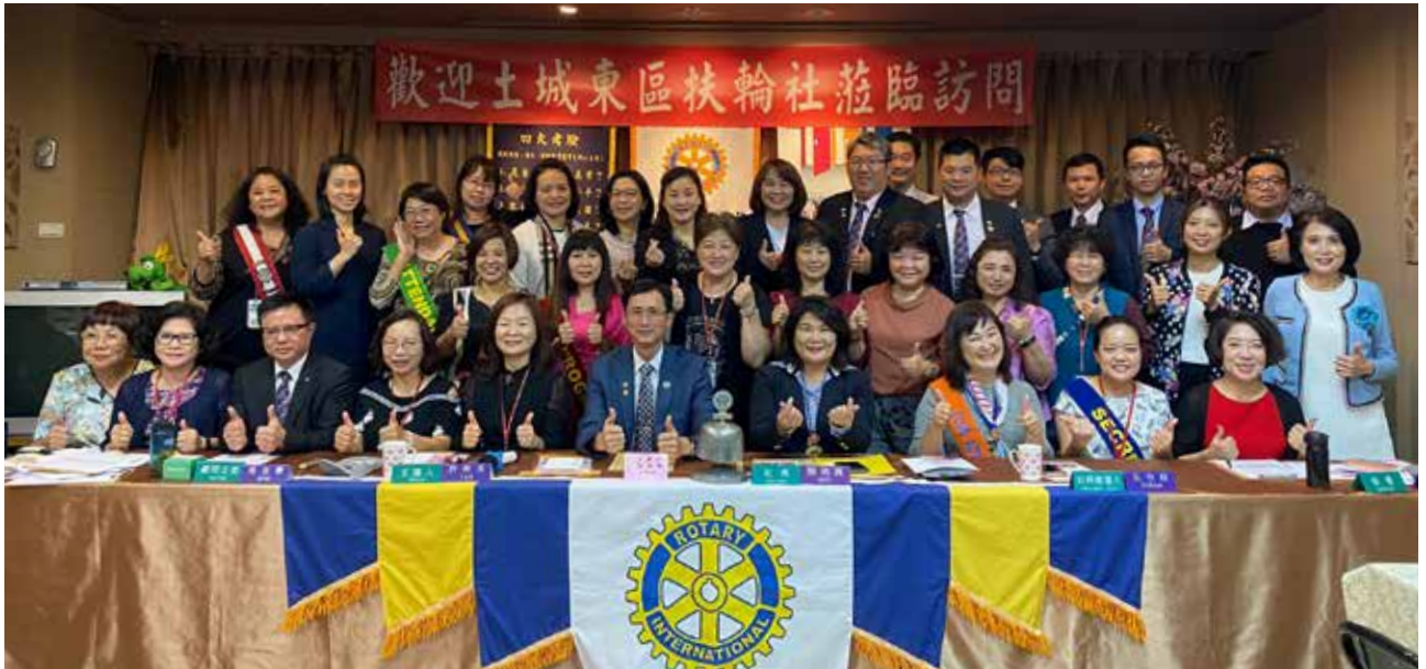
第 854 次例會 - 土東社來訪