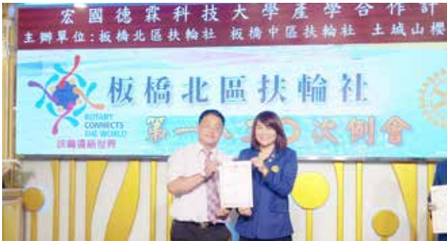
108.7.19 社區服務—指定捐款 - 德霖獎學金