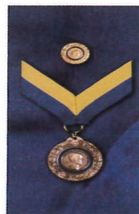
保羅哈里斯之友證書與徽章