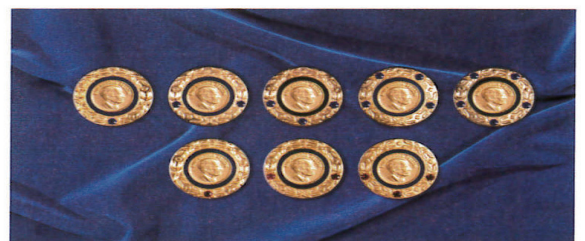
多次保羅哈里斯之友徽章