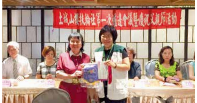
106.8.1 社區服務 - 英文課輔助學希望工程捐贈家扶中心